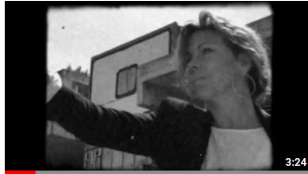
Clip "Little drop of poison" (2022)