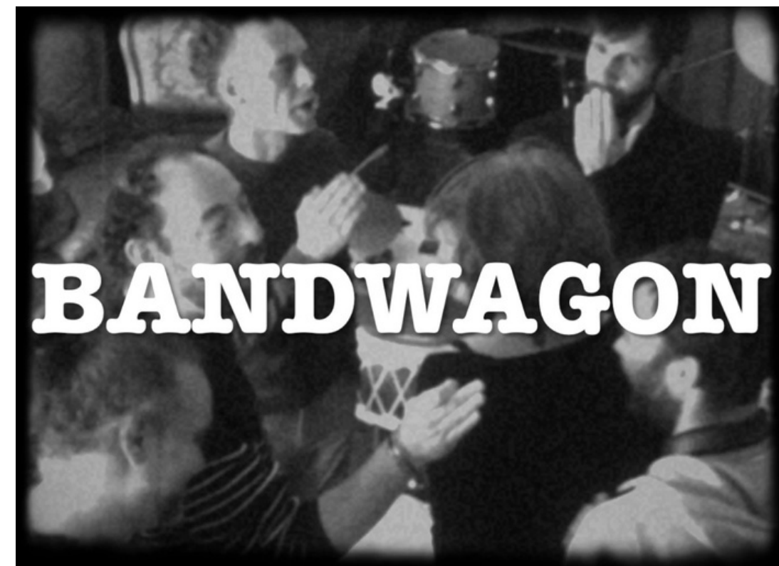
Bandwagon, Teaser #1 (2023)

Cliquez sur les images pour accéder aux liens !